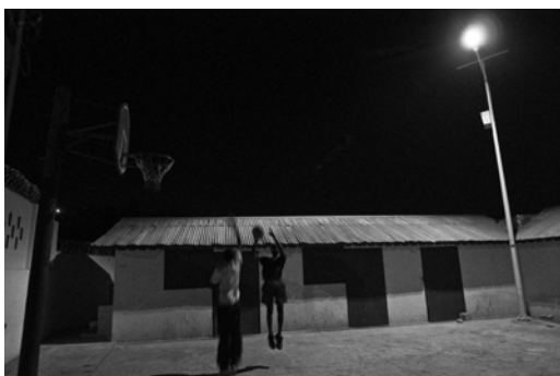
Kèk jèn k ap jwe baskèt anba yon lanp solè