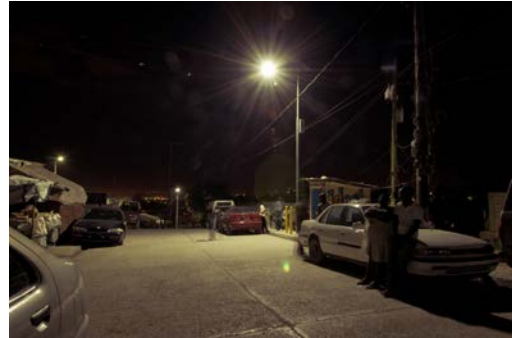
Lavi aswa ap tounen nan Nerèt,grasa nouvo lanp solè sa a, Koutwazi FRH