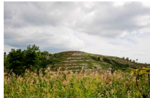
Pwojè sou konsèvasyon sòl nan Pòsali