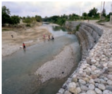
Réduction des risques à Pèlerin (Sud) : après