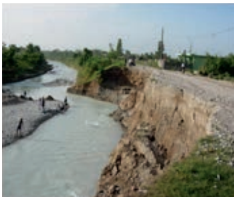
Réduction des risques à Pèlerin (Sud) : avant

Nan dezyèm lane fonksyònman lan l, FRH te resevwa lòt kontribisyon nan men kat bayè pou yon valè total US$ 44 milyon. Kontribisyon sa yo montre jan bayè yo angaje tèt yo pou yon tan ki long nan rekonstriksyon peyi D'Haïti epi ki repons yo bay san rete bezwen finansman yo pou bouche defisit finansman ki genyen. Yon total 19 bayè pran angajman pou bay FRH kontribisyon pou yon valè US$396 milyon, ladan yo te deja resevwa US$381 milyon. Finansman ki disponib nan men FRH reprezante 16% finansman total bayè bilateral ak multilateral yo dekes pou rekonstriksyon apre tranblemandtè a. Komite Pilotaj FRH la te deside finanse pou yon valè total US$278 milyon ladan US$274 milyon al jwenn 17 pwojè rekonstriksyon ala demand Gouvènman peyi D'Haïti. US$4 milyon ki rete yo ale lan men Sekretarya FRH la ak Fidisyè a pou jere fon yo (gade Tablo 1). Rive jounen jodia se US$94 milyon ki te dekes pou pwojè sila yo.